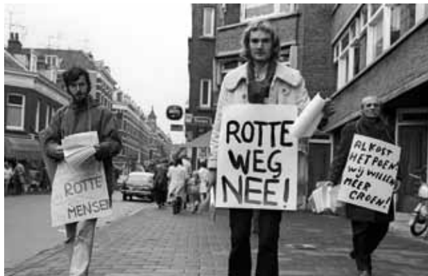
Bewonersprotest tegen gemeentelijke plannen voor demping van de Rotte voor de aanleg van een weg.